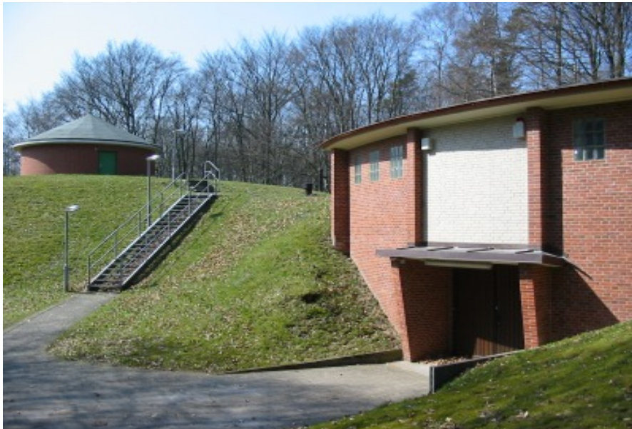
Hochbehälter Langenrehm auf dem Gannaberg, gebaut 1973

Dank des Einsatzes modernster Computertechnik ist es dem Bereitschaftsdienst nunmehr möglich die Wasserwerke, Hochbehälter und Pumpwerke nicht nur von Hittfeld, sondern auch von zu Hause aus mit dem Laptop steuern.